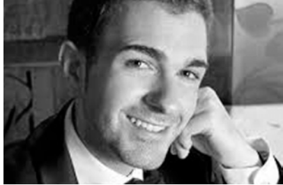
Beñat Egiarte tenor